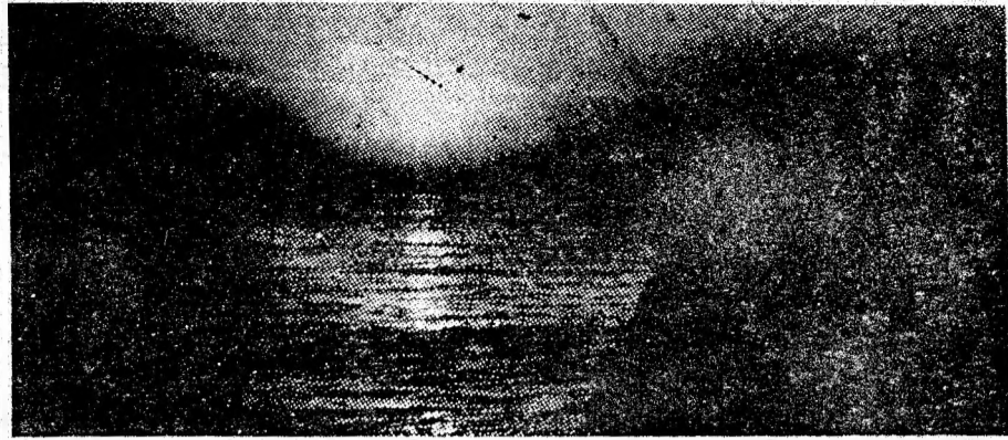
„IN AURUL LUMINII”. Fotografiile color realizată de Francisc Nemeth, din Vulcan, distins cu premiul „Hercules '80” la salonul interjudețean de artă fotografică, deschis în 24 iunie — 13 iulie 1980, la Băile Herculane.