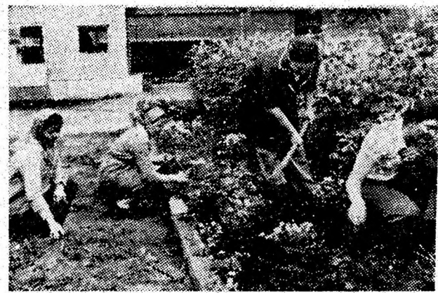
În urma muncii patriotice a uteciștilor de la S.S.H. Valean, aleile și frumoasele ronduri de flori amenajate la intrarea în curtea secției, creează o ambianță plăcută.

În incheierea manifestărilor s-au desfășurat spectacole culturale-artistice, susținute de formații ale cadrelor didactice și elevilor.