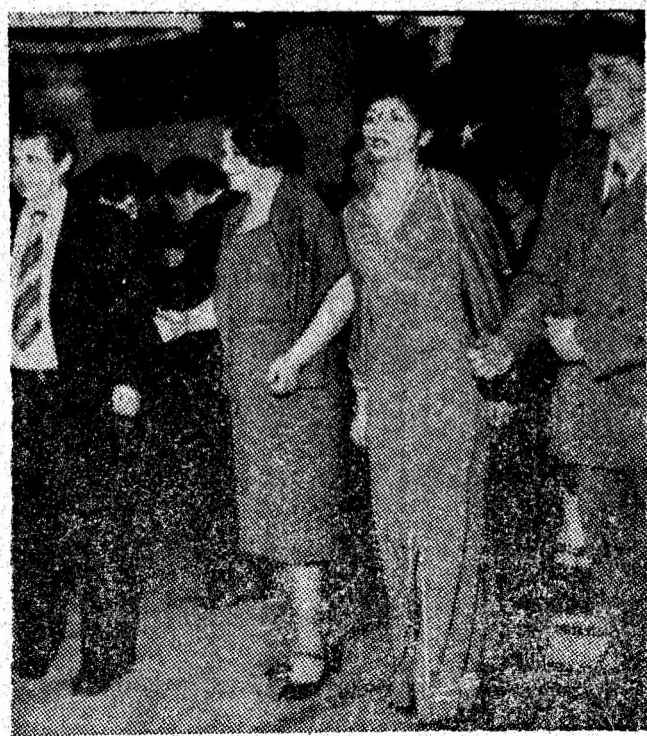
Revelionul tineretului. Casa de cultură Petroșani.

Zăpada căzută în primele zile ale noului an a creat dificultăți traficului rutier de pe arterele de circulație din zona municipiului. Carosabilul a fost acoperit cu un strat de zăpadă bătoasă între Petroșani — Baru și Petroșani — Ig. Jiu, îngreunînd circulația. În aceste condiții s-au înregistrat, din păcate, și câteva accidente. Cîțiva conducători auto care au circulat cu viteză „din grabă”, au derapat. Unele evenimente rutiere s-au soldat cu accidentări, care au dat de lucru personalului sanitar aflat la datorie, la urgență, la spitalul municipal.