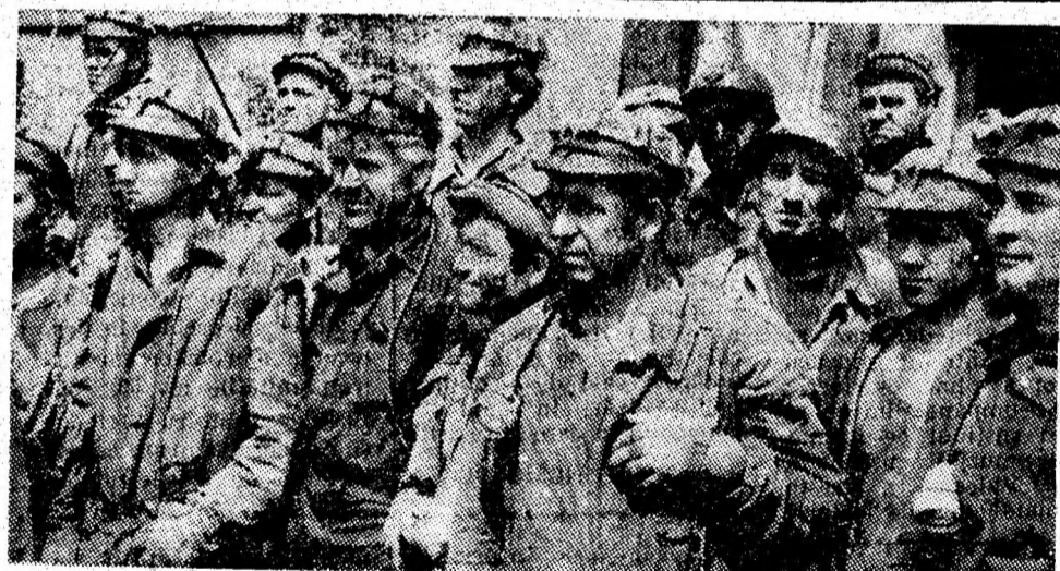
Îndeplinind sarcinile de plan ale cincinalului 1976 — 1980 înainte de termen, minerii Petroșeniului au adus o importantă contribuție la întărirea economică a patriei.