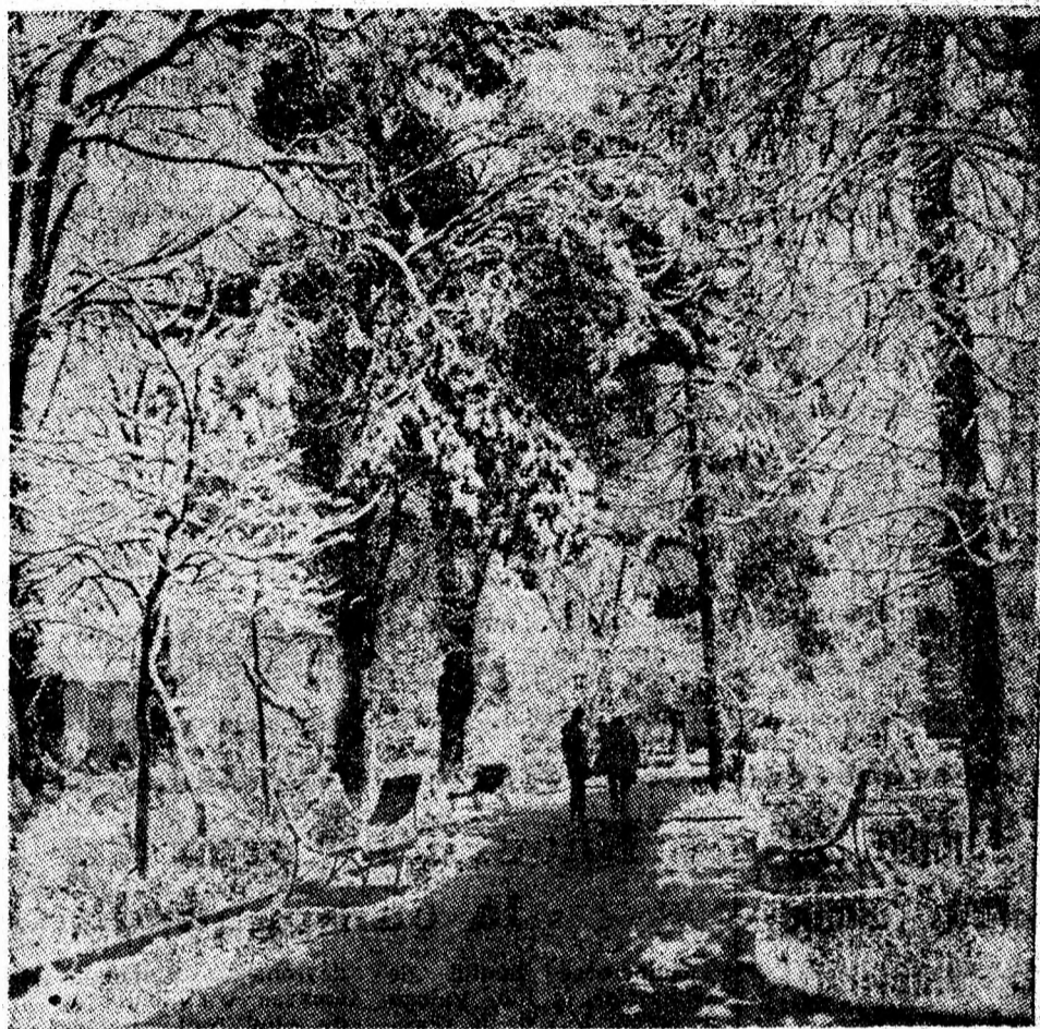
...Semne bune anul are.