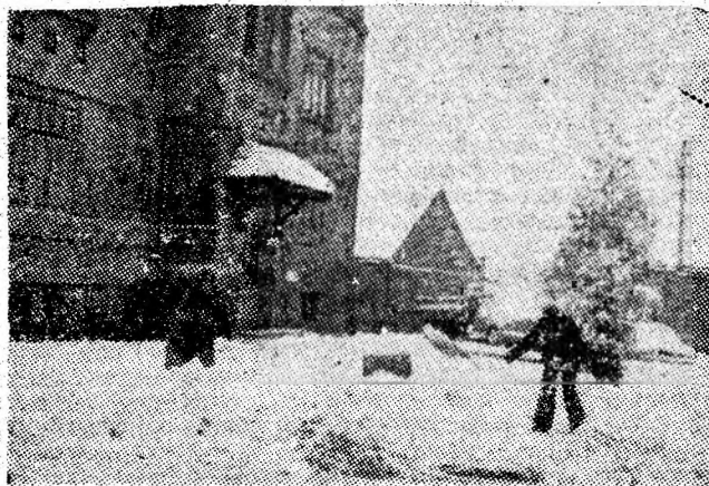
Dacă nu intervin cei ce au această obligație cetățenească, cine va curăța zăpada din fața sediului I.C.P.M.C. Petroșani?

Intrucât în zilele următoare meteorologii prevăd noi căderi de zăpadă, toți cetățenii sînt chemați să participe la acțiunea de deszăpezire. Aleile, cărările dintre blocuri, trotuarele trebuie degajate cu promptitudine de zăpadă pentru a se asigura o bună circulație pietonală, funcționarea fără perturbări a magazinelor, a tuturilor întreprinderilor și instituțiilor. Să acționăm, deci, stimati cetățeni, peste tot, cu toate forțele la deszăpezire!