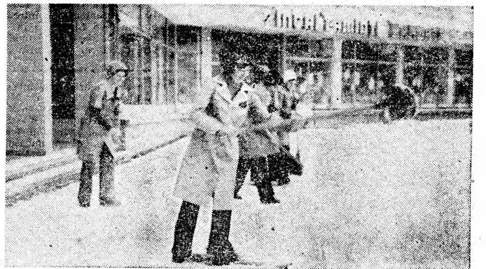
Vinzătoarele de la magazinul nr. 145 produse electrice în Vulcan au ieșit la curățirea zăpezii din fața unității.