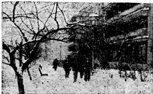
În dreptul blocului G 4 din cartierul Coroești, stratul gros de zăpadă pe care n-o curăță nimeni este o adevărată piedică pentru pietoni.

autogreder și altele. Recent a sosit un nou utilaj cu funcționalități multiple. Este vorba de un multicar, din import, care printre altele, pe timp de iarnă poate să curețe zăpada de pe trotuare și alei înguste, să imprăștie uniform pe carosabil materiale antiderapante. În curând noul utilaj va putea fi văzut la lucru pe străzile orașului. (V.S.)