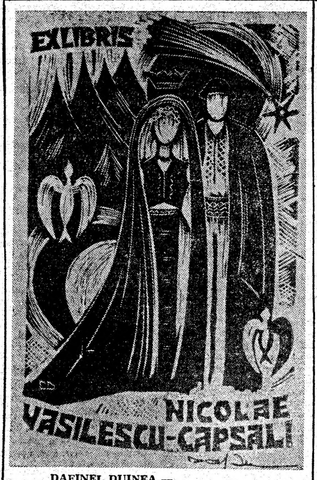
DAFINEL DUINEA — Linogravură — ilustrație pentru „Miorița”.

OLUL INA zele ac- e de cir- constituie tovehicu- șoferi a- ența bă- Se din cau- de ires- dan să ceialalt trafic, rînd ce- ră de a volan în alcooli- u „con- amator a tir- pi turismul ersonală de do- is, con- lor le- nționat ustură. în po- lui de în luna ea Că- „perfor- pierde. rile din a lunii fost o- condu- i 2.HD. restau- a drum ase bă- În fața opice a nai al- nă”. În oolul e l de la toratul iei, Di- se a- că, 11 permisă urisme- ersona- ere de FĂRĂ ată de UȚ liției