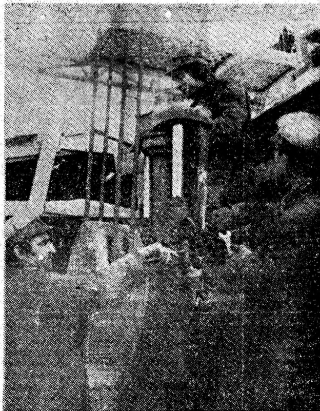
La datorie, sondorii de la una din instalațiile de foraj.