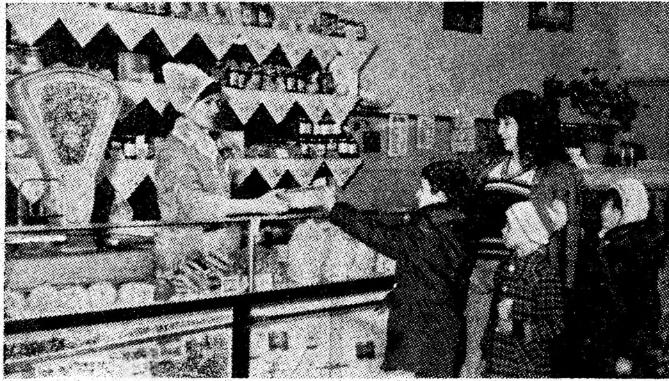
Cofetăria „Scala” din Petrița este o unitate comercială solicitată de un mare număr de cumpărători, în majoritate copii. Ea este mult apreciată pentru modul civilizată de servire, precum și pentru varietatea și calitatea produselor.