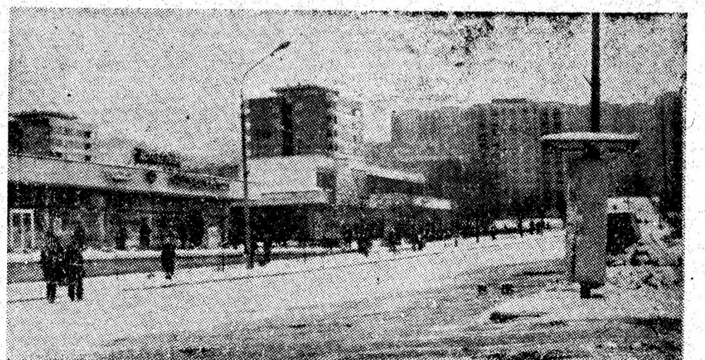
Vulcanul a îmbrăcat manșia albă a miezului de iarnă.

bun. La locurile de muncă fie că e vorba de bucatărie, școală sau atelier, contradicțiile sînt inevitabile. Prin critică nu facem altceva decît să încercăm balanța rațiunii cu ceea ce este bine. Să nu ne temem de critică. Ea nu este așa cum consideră unii o plagă a caracterului uman. Este, dacă se poate spune așa, cea mai pașnică armă folosită în combaterea unor mentalități perimate care tulbură într-un loc sau altul apele limpezi ale societății. Valeriu BUTULESCU