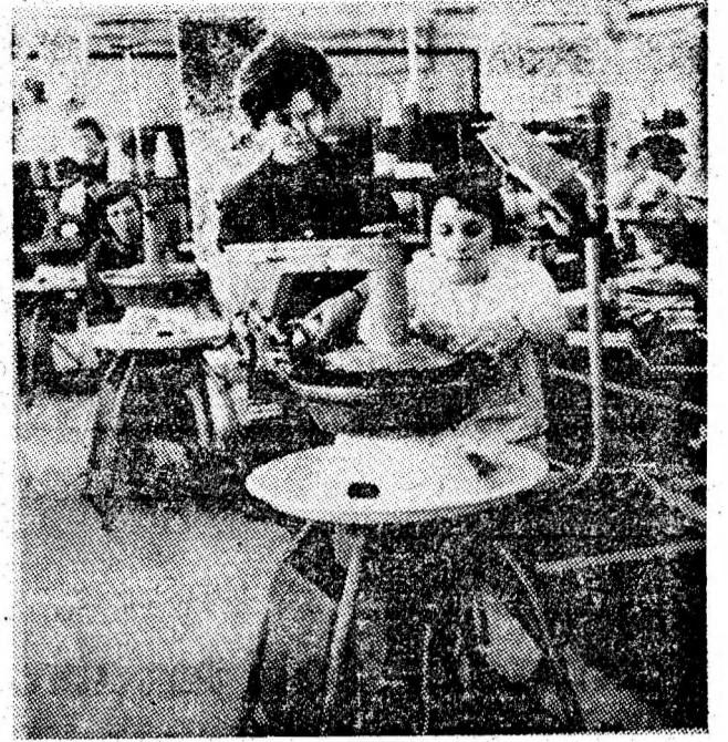
Întreprinderea de tricotaie Petroșani, construită în cadrul planului suplimentar adoptat la indicația secretarului general al partidului, tovarășul Nicolae Ceaușescu, a ajuns cunoscută în toate colțurile țării, datorită varietății și calității produselor executate.