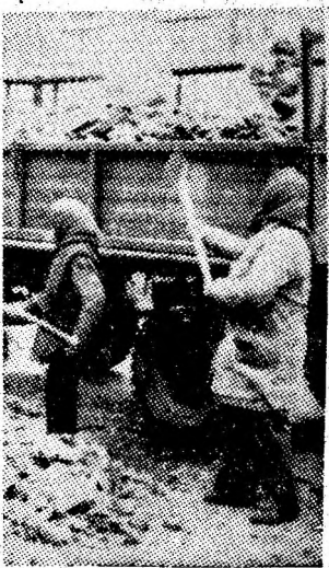
„Mai e de transport multă zăpadă și gheață.”