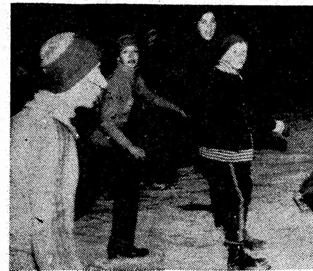
„Mai bine mai tirziu decît niciodată” — zicala care se potrivește patinoarului din Lupeni. Imaginea surprinsă de noi declanșează copiii din celelalte orașe din Valea fireasca întrebare: „Pe cînd și la noi?”.

— Turneele au însemnat o recunoaștere deplină a rugbiului românesc, sta-