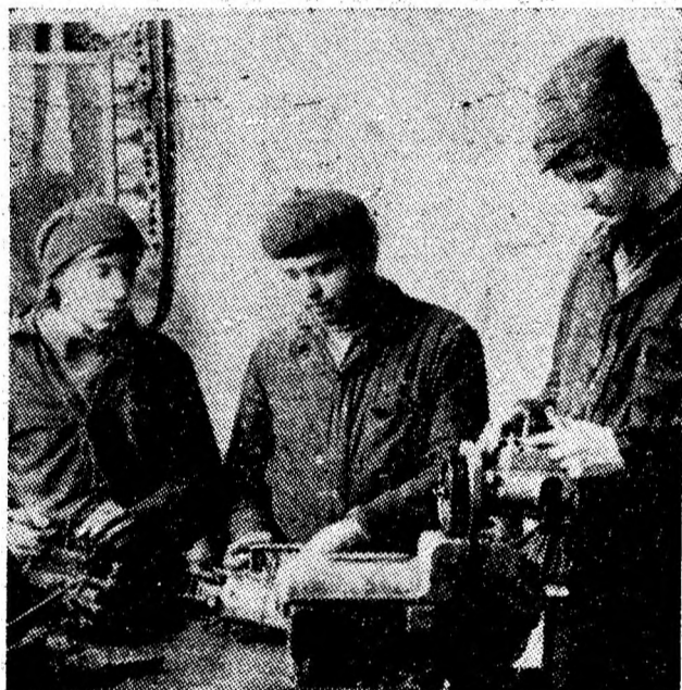
Instantaneu de muncă din atelierul mecanic aparținînd S.U.T. Iscroni.