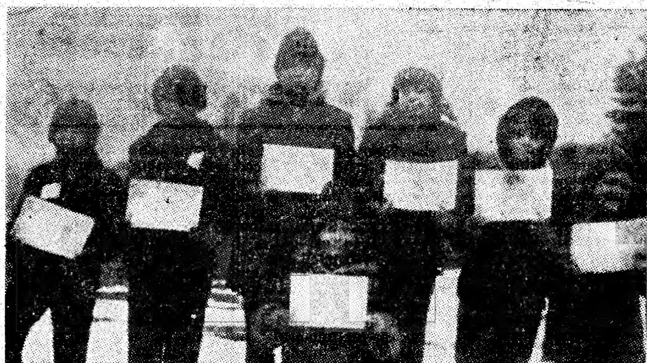
Moment festiv la locul de agrement Brățu — Lupeni. Pe podium, cîștigătorii probei de sanie desfășurată pe pîrtia de aici.