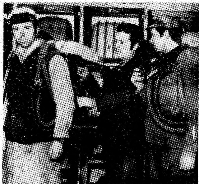
Echipa de salvare de la I.M. Paroșeni, la una din antrenamentele care au ca scop o intervenție rapidă și eficientă în acțiunile de lichidare a avariilor.

De asemenea, se vor evidenția atît zonele sistificate cit și barajele cu praf inert. ● Pentru funcționarea corespunzătoare a capetelor de detecție se vor lua măsuri de nominalizare a persoanelor cărora le revine obligația să verifice în fiecare schimb, amplasarea acestora în conformitate cu prevederile instrucțiunilor, anexă la N.D.P.M. — AM ed. 1977 și a programelor aprobate de conducerea unităților.