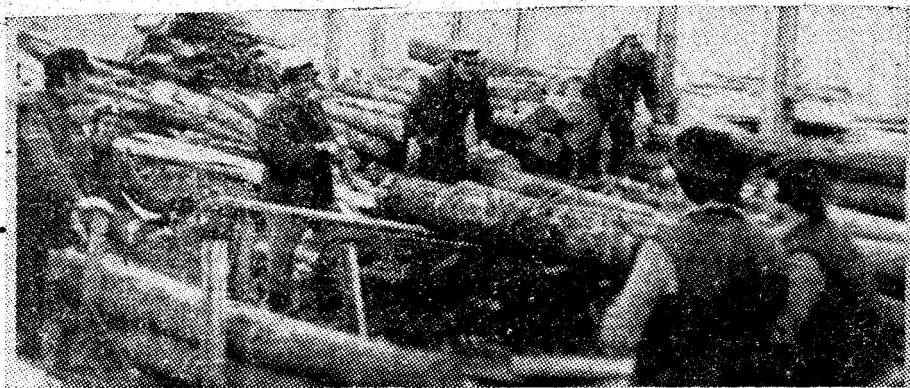
Duminică, 22 februarie 1981, un grup de comuniști și uteciști aparținând personalului TESA de la I.M. Lonea, au participat la muncă patriotică în depozitul de materiale.

Reafirmăm și cu acest prilej deplină adeziune la politica internă și externă a partidului și statului nostru care corespunde intrutotul celor mai înalte aspirații ale poporului nostru, cauzei menținerii și apărării păcii în lume.