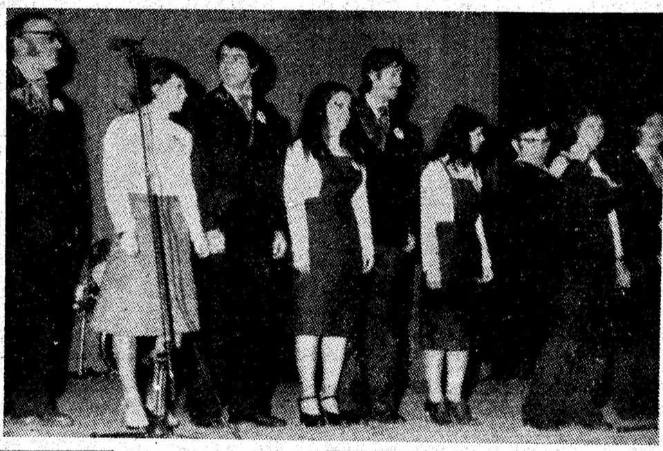
Grupul de satiră și umor, formație educativ-artistică ce activează la I.M. Petrița, evoluează pe scenă în cadrul Festivalului național „Cîntarea României”, stîrnind admirația colegilor de muncă, dăruirea și talentul lor pe tărîmul artistic meritînd prețuire.