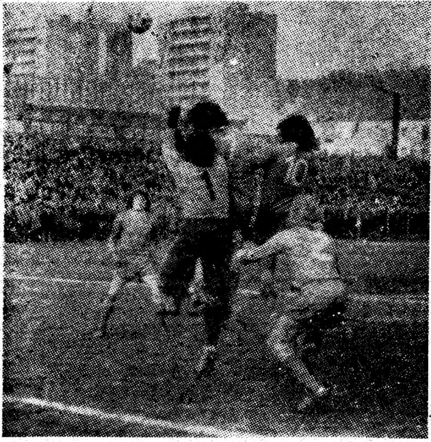
Defensiva dinamovistă a avut „de furcă”, în după amiaza de sîmbătă, cu Sălăgean, Stoichiță și comp. Înaintarea Jiului și-a creat multe situații de superioritate, înscriind în două rînduri.