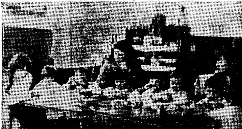
O imagine din activitatea grădiniței cu program săptămânal din Lonea.