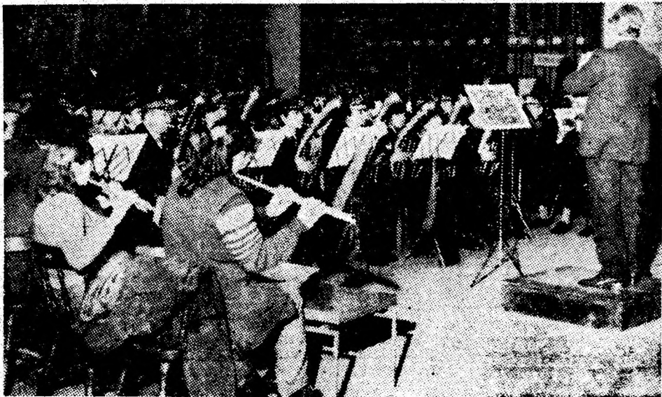
Fanfara minerilor din Valea Jiului, formație clasificată pe primul loc la recenta etapă județeană a Festivalului național „Cîntarea României”.