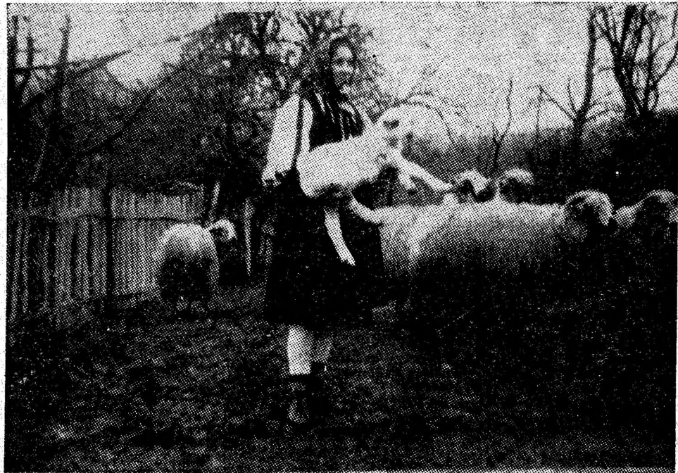
Semne de primăvară.