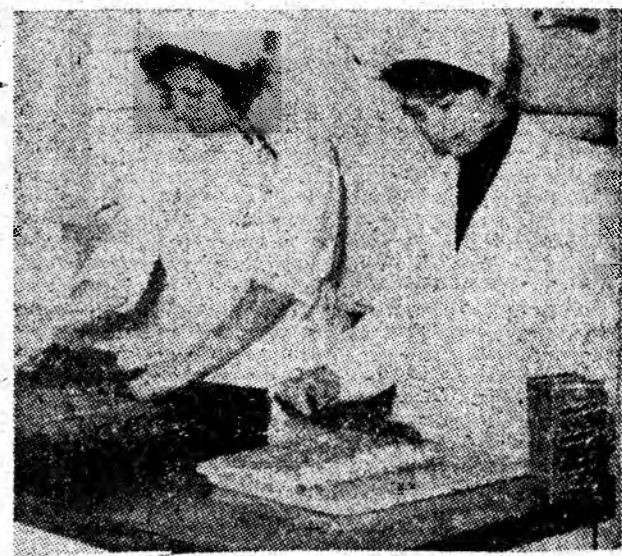
La cantina studenților de la I.M.P., studentele de serviciu pregătesc prăjituri pentru colegii lor care servesc masa aici.

Avind în vedere sarcinile trasate de conducerea de partid și de stat privind rentabilizarea unităților economice, în condițiile actualizării prețurilor de producție și de livrare, nerealizarea indicatorilor de calitate are