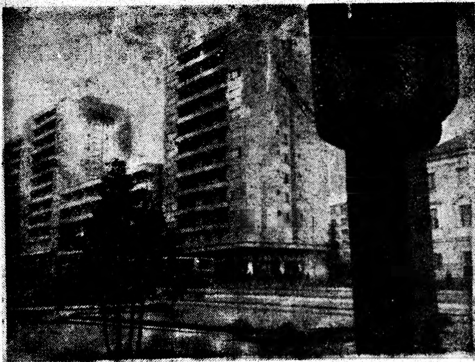
Zi de primăvară la Petroșani.