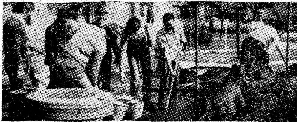
Pe Aleea Crizantemelor din Vulcan se lucrează la amenajarea de noi straturi pentru flori.