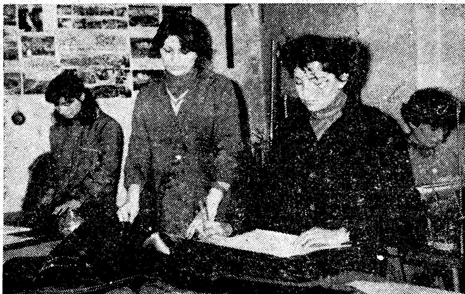
Colectivul secției de marochinărie din cadrul cooperativei „Straja” din Lupeni se numără printre formațiile de lucru cu cele mai bune rezultate. Produsele executate aici sînt deosebit de apreciate atît de cumpărătorii din Valea Jiului cît și de cei din peste 20 de județe, unde unitatea își desfășoară activitatea.

Ceea ce întreprinde în aceste zile colectivul minei Livezeni, organizația sa de partid, este identic cu trecerea unui examen al maturității politice și economice. De aceea activitatea concretă a comunistilor în brigăzi, acțiunile colectivelor de agitatori de la locurile de muncă, dezbaterile în adunările generale ale organizațiilor de bază vizînd materializarea măsurilor de impulsioneare maximă a activității productive și de amplificare a realizărilor la cărbune, propaganda audio-vizuală privind popularizarea obiectivelor de muncă ale colectivelor din sectoare, întreaga activitate politico-educativă avînd ca scop creșterea spiritului de angajare în muncă, întărirea ordinii și disciplinei se desfășoară la o înaltă amplitudine. Sînt temelii trainice ale succeselor pe care colectivul minerilor de la Livezeni le pregătesc pentru a le aduce drept înalt omagiu muncitoresc zilei de 1 Mai și celei de-a 60-a aniversări a partidului.