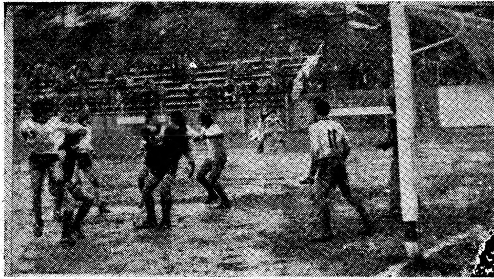
Fază din meciul Minerul Paroșeni — Victoria Călan.