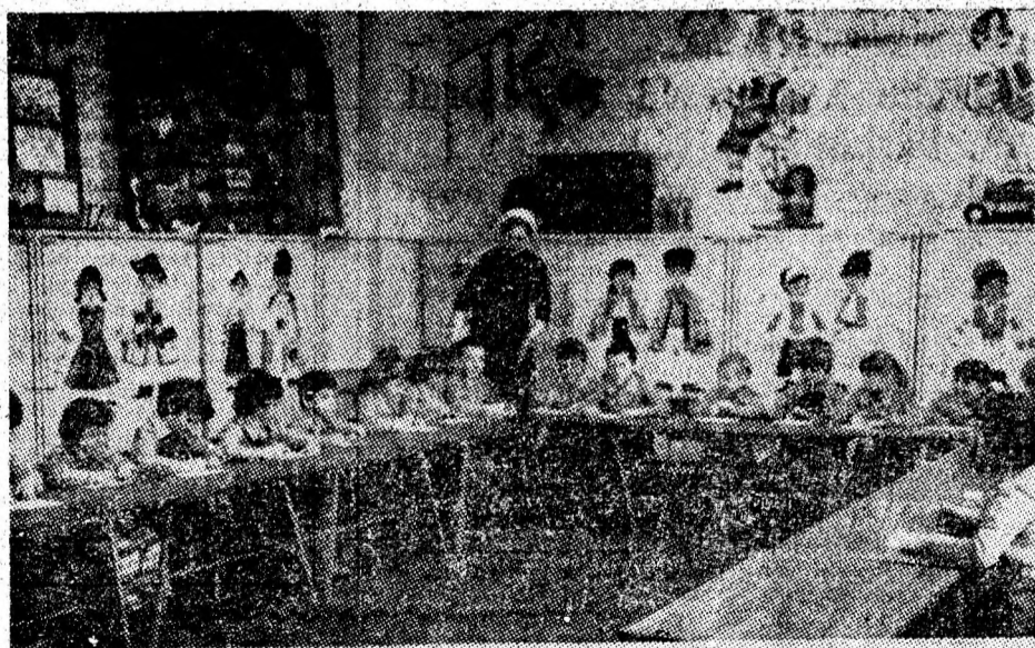
Intr-un cadru intim, plăcut, familial, copiii de la „grădinița cu program prelungit din cartierul Carpați, Petroșani, petrec clipe plăcute în compania „tovarășei”, cîntînd, învățînd, jucîndu-se.

Preocuparea pentru sporirea zestrei floricole a comunei Aninoasa s-a concretizat, în această primăvară, în sădirea a peste 2000 fire de flori și a mai bine de 100 de trandafiri. Au fost amenajate ronduri cu trandafiri și alte flori în fața căminului de nefamilisti și la blocul „7 Noiembrie” de pe artera centrală a comunei. În intersecția Isroni se realizează un frumos scuar cu trandafiri și alte flori. A fost, de asemenea, întinerit cu peste 150 de puieți fondul de pomi fructiferi al comunei.