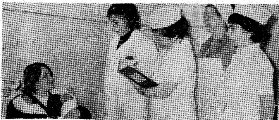
Un colectiv al probității profesionale, colectivul maternității din cadrul spitalului Vulcan, al oamenilor care stau de veghe zi și noapte, care muncesc neobosiți pentru ocrotirea tinerelor vîrstare ale țării. În imagine instantaneu din timpul unei obișnuite vizite într-unul din saioanele maternității.