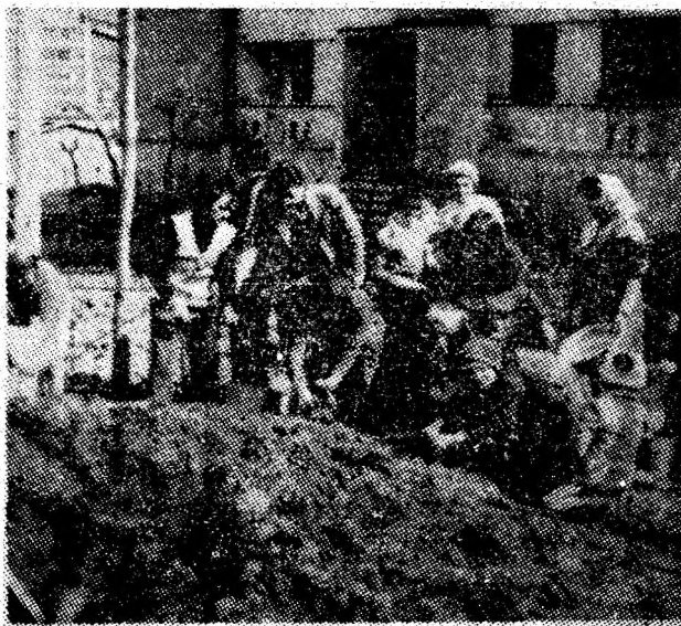
Locatarii blocurilor D 10 și D 11 din cartierul Co-roesti — Vulcan, ieșiți în număr mare la muncă patriotică, au reamenajat spațiul din fața blocurilor.

La nivelul orașului Lupeni, baza materială a economiei se va întări și moderniza, condițiile de muncă și viață vor cunoaște în continuare noi îmbunătățiri. Se va lărgi, ca în întreaga societate, participarea oamenilor muncii la organizarea și conducerea activității economico-sociale. Din toate aceste mutații prefigurată, se va adînci procesul de afirmare a conștiinței socialiste înaintate, de formare și dezvoltare a personalității umane, în plenitudinea talentului creator ce îi este propriu. Talentul maselor este pus în slujba societății și această realitate înălțătoare face ca bilanțul nostru să fie de neasemuit, și din ce în ce mai bogat, însumînd transformările revoluționare care îmbogățesc, în primul rînd, omul.