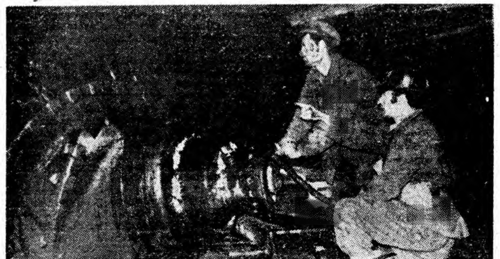
Mineri-tehnicieni în abatajele mecanizate ale Văii Jiului.