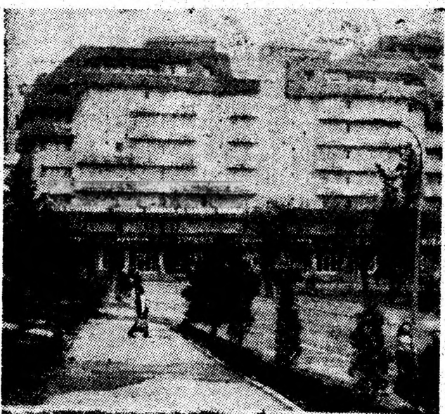
Edificii impunătoare, într-o viziune arhitectonică modernă, conturează viitorul centru civic al reședinței municipiului nostru.

Este obiectivul pentru realizarea căruia trebuie să acționeze cu stăruință, răspundere și inițiativă toate formațiile de lucru, toate cadrele tehnico-ingineresti, întregul colectiv al minei.