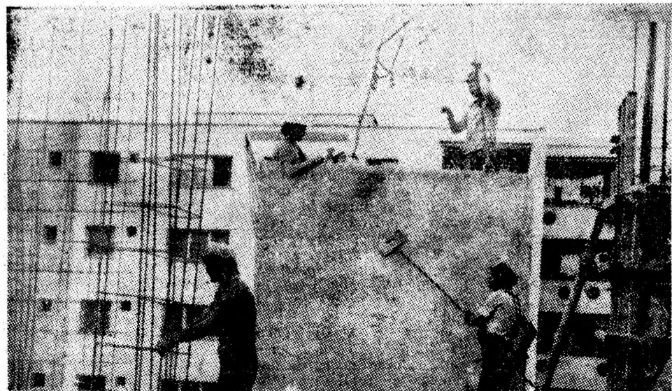
În curînd, zestrea de locuințe din noul centru civic al Vulcanului se va îmbogați cu încă 38 de apartamente prin darea în folosință a blocului 17 BCD.