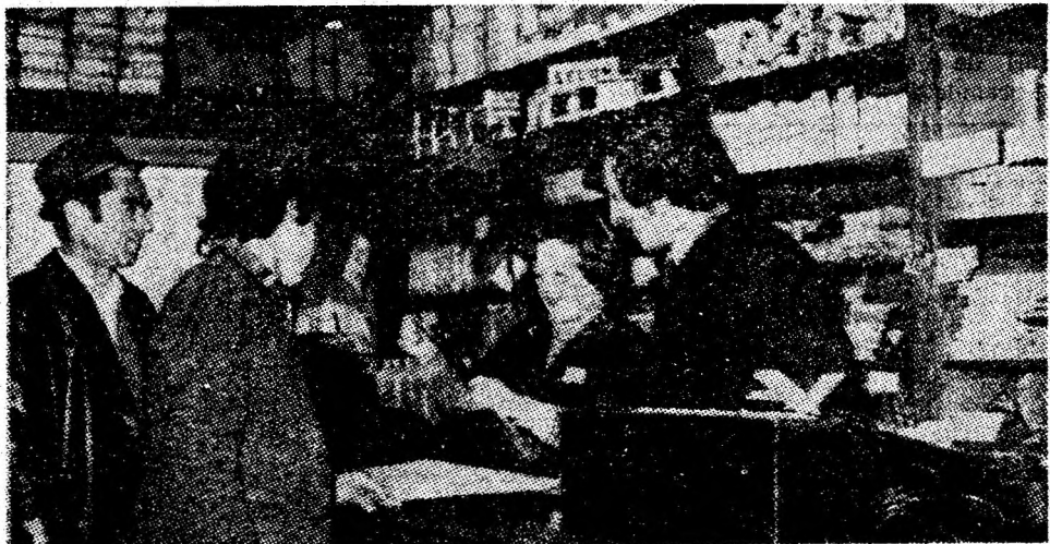
Instantaneu de la magazinul cu piese auto-moto din Petroșani.