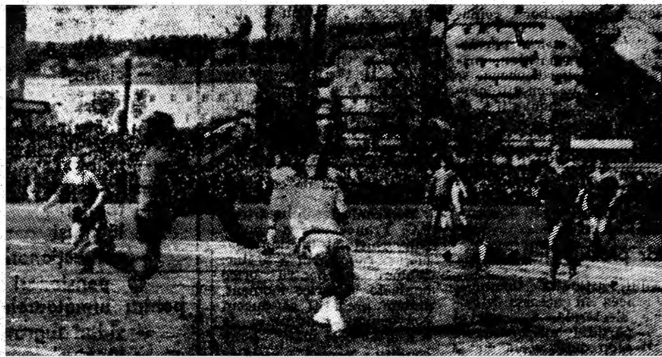
Încă un atac al gazdelor este ratat în careul studenților ieșeni. Fază din meciul Jiul — Politehnica Iași.

Așadar, între 2 și 7 iunie C.S.S.P. va lupta la Sibiu, alături de formațiile similare din Cluj-Napoca, Piatra Neamț, Constanța, Brașov și Steaua București pentru un loc pe podiumul laureatelor actualii ediții. (I.V.)