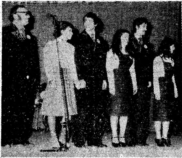
Aspect dintr-un spectacol susținut de formația de estradă de la Întreprinderea minieră Petrila.

Caii albi mină stringea îmi pribegeau prin sînge simțeam că privindu-i cu ei e o zîină pe cale mai albă — ce piînge. printre flori fără flori Caii albi dar stringînd în privire coama lor de lumină flori ardea zîna albă topea pacea zîna mică și albă albă-n petale. o floare mai albă pină la sînge — în Nell, Terezia BÂNCILĂ.