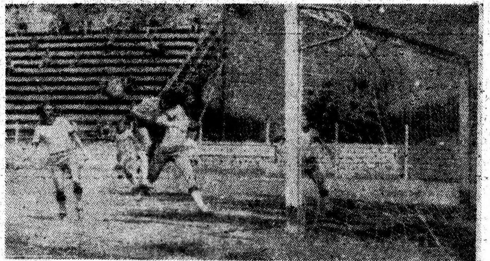
Fază din meciul Minerul Paroșeni — Construcții Sibiu. În urma unui atac prelungit în careul sibian, Lăzăroiu înscrie spectaculos, printr-un șut puternic, din mijlocul unui buchet de jucători.