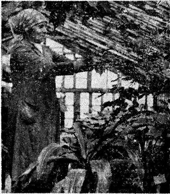
Mii de flori, sădite cu dragoste de harnicele muncitoare ale serei din Vulcan a E.G.C.L., au fost plantate, în această primăvară, în parcurile orașului.

Locuitorii orașului, oameni ai muncii din întreprinderi și instituții, tineretul școlar au efectuat până în prezent 115.000 ore muncă patriotică în activitatea de construcții, termoficare, dotări și amenajări edilitar-gospodărești și de înfrumusețare a orașului. Valoarea lucrărilor realizate se ridică la aproape 18 milioane lei. Au fost plantate cu legume și zarzavaturi 9.200 mp terenuri din fața blocurilor și teren rezervă de stat, 16.000 fire pomi fructiferi, arbori și arbuști ornamentali. De asemenea au fost reparate și întreținute 26 km de drumuri în Crividia, Dealul Babi, pe strada A-batorului,