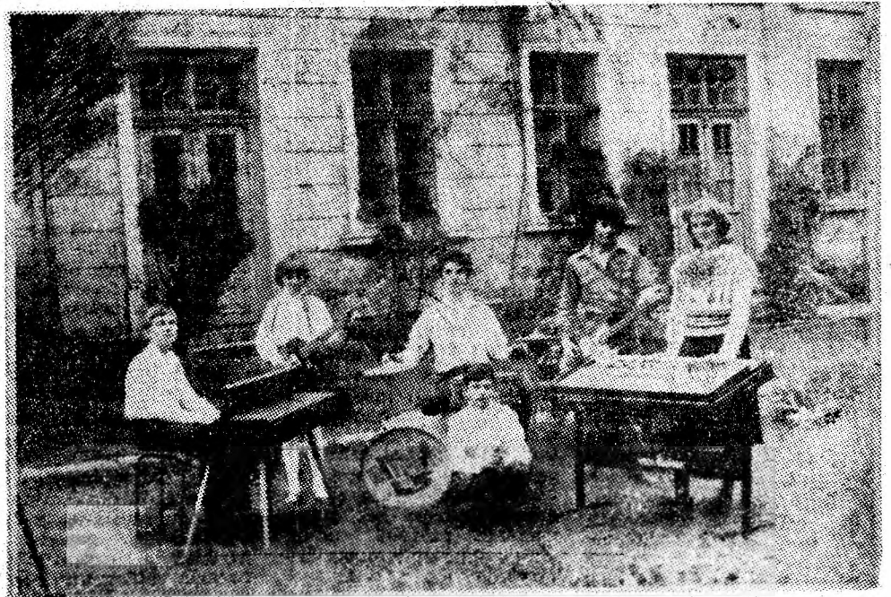
Formația de muzică ușoară „Ritmice L5” a Școlii generale nr. 1 Lupeni, laureată a Festivalului național „Cîntarea României”.