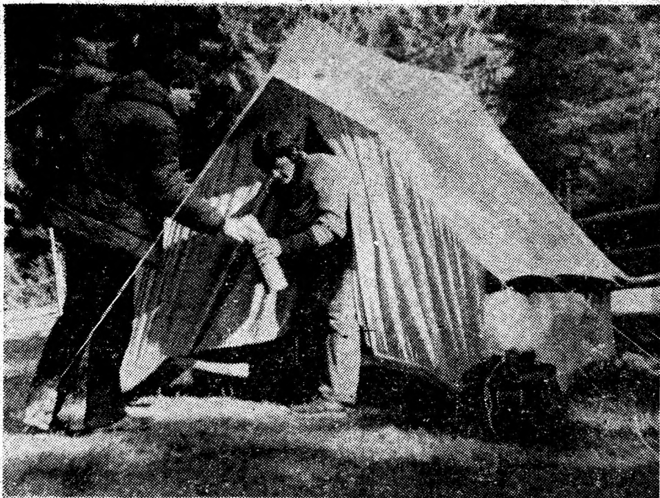
Sezonul estival. Invitație pentru petrecerea unor clipe de odihnă incintătoare, în mijlocul naturii.

Alte cîteva urgențe: I.A.E. Petroșani să grăbească confecționarea suporturilor pentru bănci; Fabrica de mobilă Livezeni să onoreze comanda de timplărie pentru stadion (termenul de livrare luna aprilie) de care este legată avansarea lucrărilor de finisaj la spațiile de cazare, vestiare și celelalte încăperi.