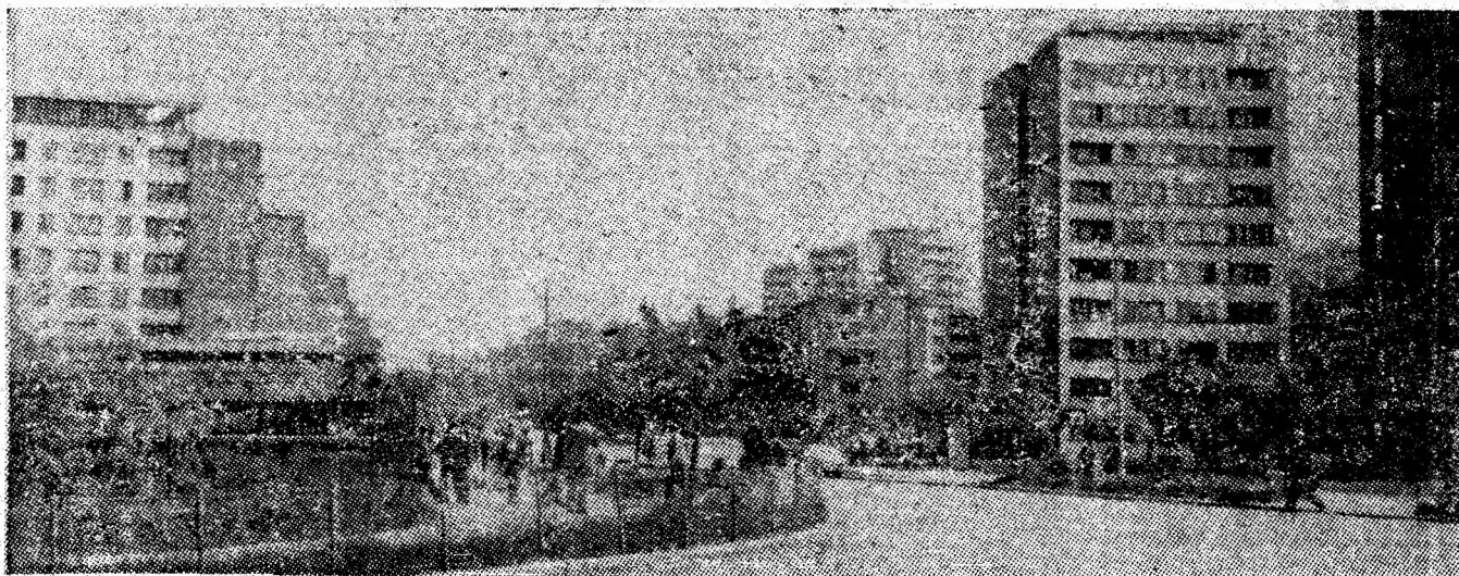
Armonie în dezvoltarea urbanistică a așezărilor muncitorești ale municipiului.