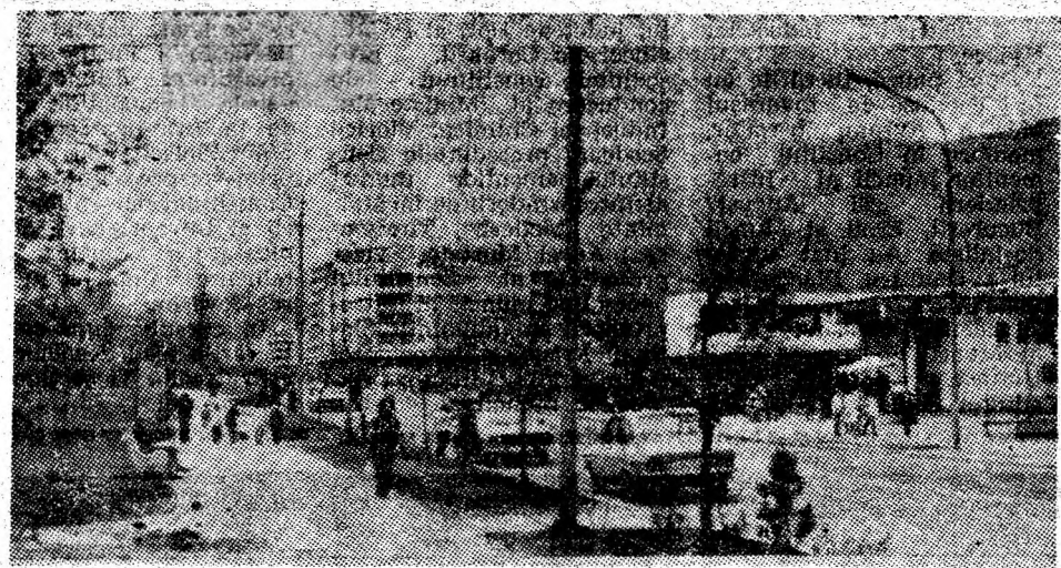
Vedere spre zona viitorului centru civic al orașului Vulcan.