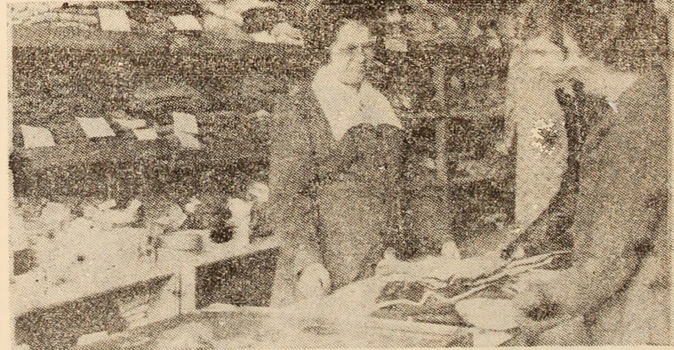
Unitatea nr. 99 cu mărfuri de mercerie-tricotaje din cartierul Carpați — Petroșani, este una dintre apreciatele unități comerciale de profil datorită serviriilor civilizate și varietății mărfurilor existente aici.

— zgrăviră și repararea parchetului la ca-