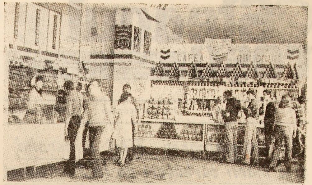
Instantaneu din cadrul magazinului alimentar nr. 267 din cartierul Braia - Lupeni, al cărui colectiv își depășește lunar sarcinile de plan cu peste 200 mii lei.

„În vederea asigurării unei eficiențe ridicate, este necesar să acționăm continuu pentru reducerea cheltuielilor materiale de producție, sublinia Iosif Birșan, șeful contabil al C.M.V.J. Dintr-un inventar de 60965 stâlpi hidraulici în valoare de 160 milioane lei nu se folosesc decît 40 la sută, restul fiind în reparații sau defecte. Situații similare sînt și în utilizarea mijloacelor de transport (transportoare cu bandă și raletete) a căror amortisment anual este de 385 milioane lei, participînd la costul tonei de cărbune cu