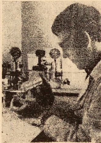
Laboratorul de explorări clinice al spitalului municipal Petroșani.

pentru a participa la înfăptuirea Programului ideologic al partidului. În paginile ziarelor trebuie să fie surprins însuși frează vîntului pentru a contribui, dinamic, suplu și combativ, la progresul țării. Pentru lucrătorii din presă, pentru toți oamenii muncii din Valea Jiului, nu este un exemplu mai însuflețitor decît cel oferit, zi de zi, de tovarășul Nicolae Ceaușescu, secretar general al partidului, care, subliniind funcțiile presei, spunea: „Trebuie să avem permanent în vedere că noua etapă de dezvoltare a patriei noastre presupune eforturi susținute, alit materiale cît și spirituale o largă activitate științifică culturală, ridicarea continuă a nivelului de pregătire profesională, tehnică, științifică și politică, a tuturor oamenilor muncii. Aceasta este condiția primordială pentru asigurarea mersului ferm al patriei noastre pe drumul societății socialiste multilaterale dezvoltate, pentru trecerea la o nouă etapă și înfăptuirea unei civilizații superioare în patria noastră”. Acum, în aceste zile de august, cînd facem un bilanț al înfăptuirilor în cei 37 de ani de la revoluția de eliberare socială și națională, antifascistă și antiimperialistă, contribuția presei este integrată în tot ce s-a înfăptuit, determinînd o activitate calitativ superioară apropiată omului și aptă să însuflească și energii în opera de înălțare socialistă a patriei.