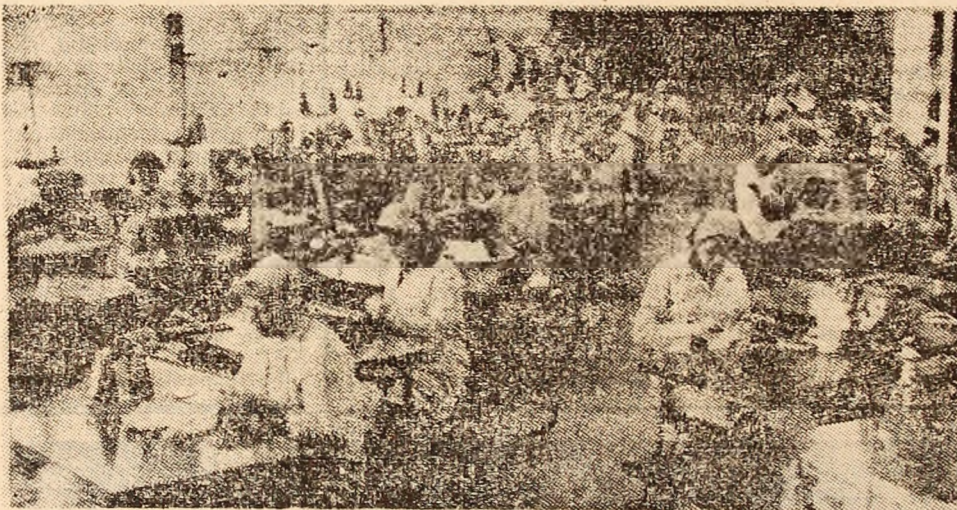
Întreprinderea de tricotație Petroșani, apreciată de numeroși beneficiari din țară și de peste hotare pentru varietatea sortimentală, linia modernă a modelelor și calitatea produselor executate, se numără printre unitățile economice importante ale municipiului nostru.

poate spune că activitatea, în pofida unor dificultăți obiective, se desfășoară normal. Problemele legate de preluarea cărbunelui din gara Bărbăteni, vor constitui tema unei analize detaliată a situației și datorită faptului că, în urma intervențiilor noastre, la redacție ne-au sosit răspunsurile de la C.M.V.J. și I.P.C.V.J. Răspunsuri care, pare-se, nu prea seamănă între ele în explicarea situației create în gara Bărbăteni.