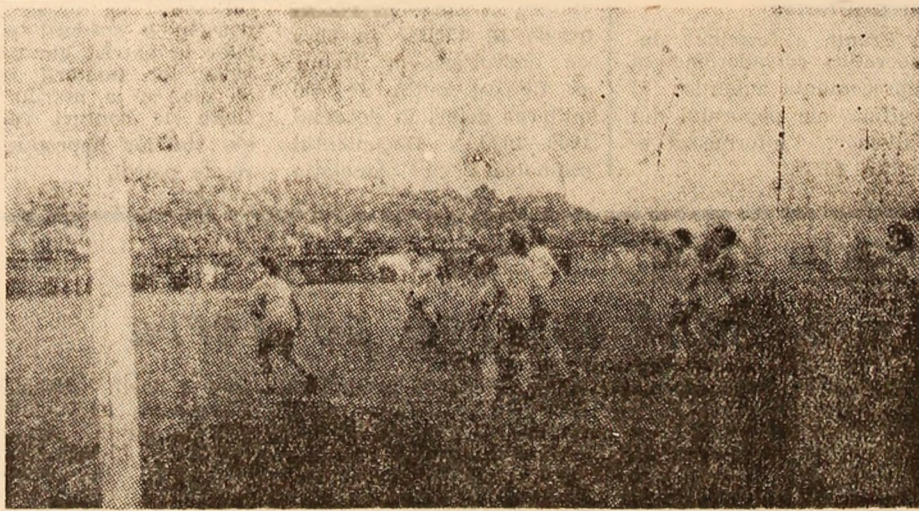
Fază din meciul Minerul-Știința Vulcan — Minerul Paroșeni.