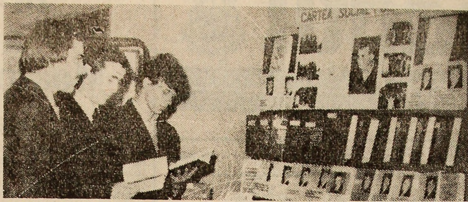
La standul cărților cu tematică social-politică de la Institutul de mine Petroșani, studenții au posibilitatea să se documenteze cu o bogată bibliografie de specialitate.