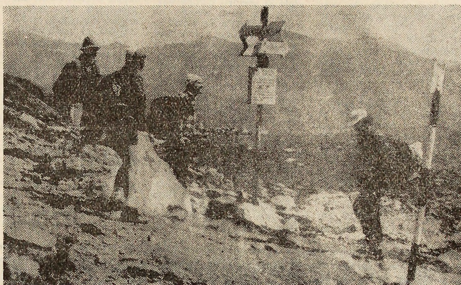
„La răscruce de vînturi“.