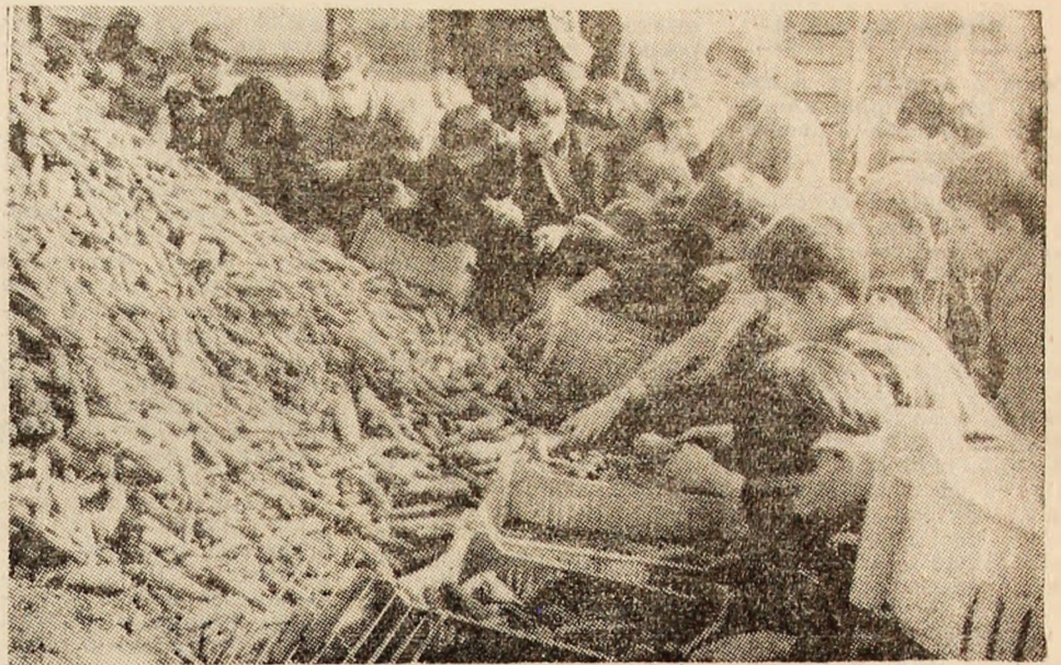
În timpul orelor de practică productivă elevii de la Liceul industrial Petroșani participă la sortarea a zeci de tone de legume și fructe în depozitul central C.P.V.I.L.F. din localitate. În imagine un instantaneu din sectorul sortării morcovilor unde elevii au ales pe categorii de calitate.