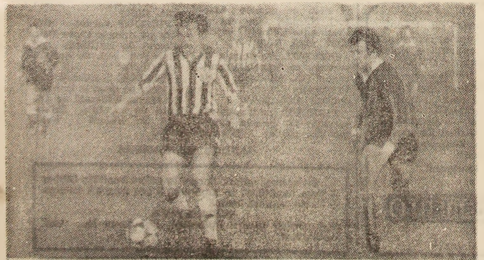
Fază din meciul Jiul — Sportul studențesc.