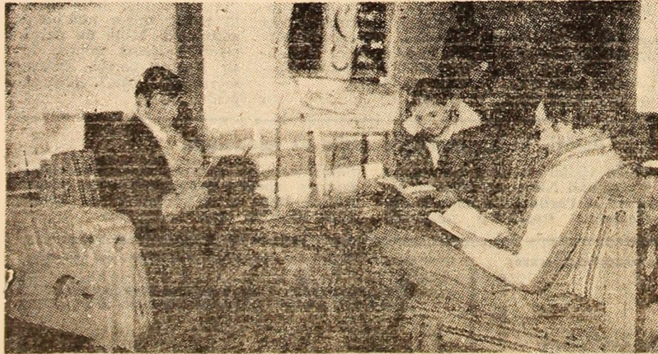
Una din cele mai atrăgătoare colțuri turistice ale Văii Jiului este motelul Valea de Pești. În imagine holul recepției.