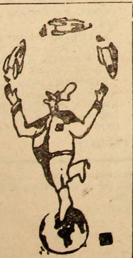
Desen de Ion BARBU