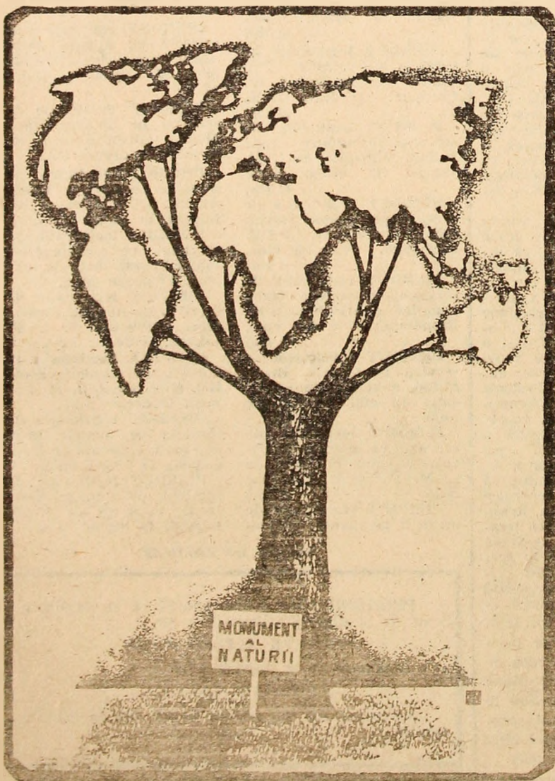
CONSTANTIN CIOȘU — Bacău