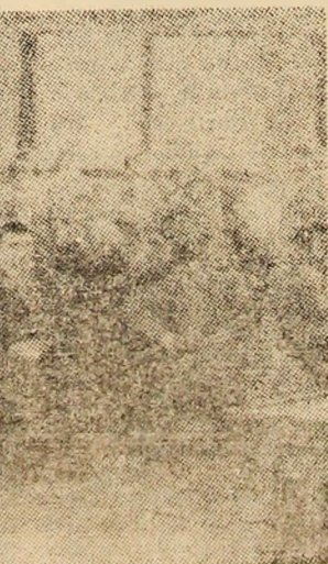
Aspect din timpul adunării festive.