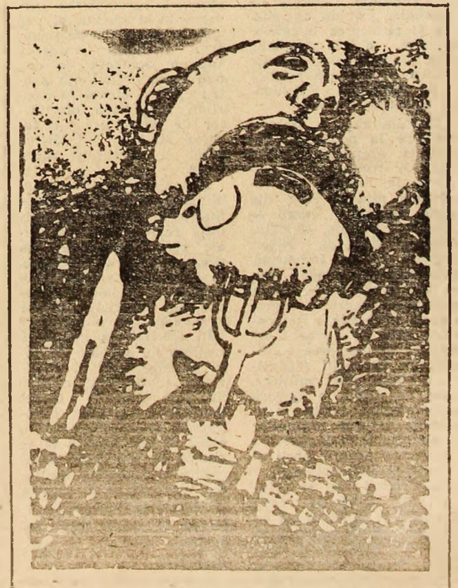
MOLNAR BERES — Tîrziu Mureș