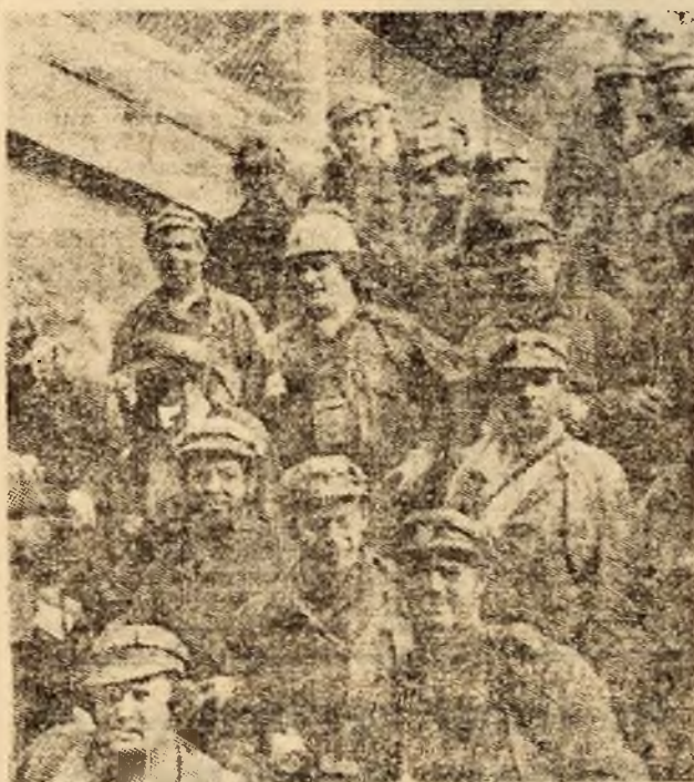
Ies din mină, harnicii minerii de la I.M. Lupeni, cei ce prin munca lor de zi cu zi, prin sutele de tone extrase din abatajele subterane ale minei, asigură pînea energetică a economiei noastre naționale.

Puternica mobilizare a potențialului colectiv de muncă, utilizarea la parametri ridicați a zestrei tehnice din dotare au condus la depășirea sarcinilor zilnice planificate la un număr de cinci întreprinderi miniere: I.M. Bărbăteni — plus 637 tone de cărbune peste plan; I.M. Vulcan — plus 509 tone; I.M. Paroșeni — plus 496 tone; I.M. Uricani — plus 314 tone; I.M. Lonea — plus 82 tone de cărbune.