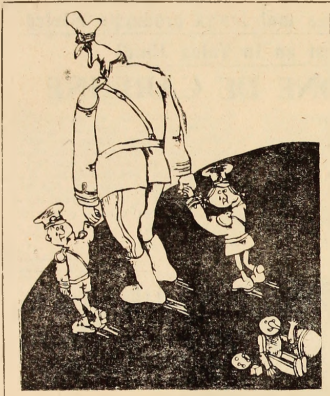
Desen de Mihai BARBU

Pe fondul activității rodnice desfășurate în aceste zile, comitetul de partid pe mină acționează, deci, tocmai pentru a valorifica acest teren bun, în folosul creșterii eficienței acțiunilor educative. Pe această cale, întreaga muncă de propagandă este orientată spre mobilizarea formațiilor de lucru, a tuturor oamenilor muncii pentru ca anul 1981 să fie încheiat în mod exemplar pe măsura posibilităților ce ne sint create, la nivelul cerințelor ce stau în fața fiecărui colectiv minier din Valea Jiului.